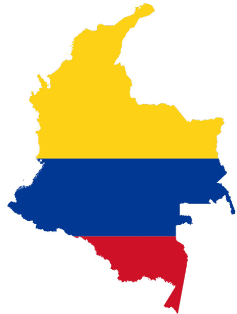
Colombia, con detalle de bandera.