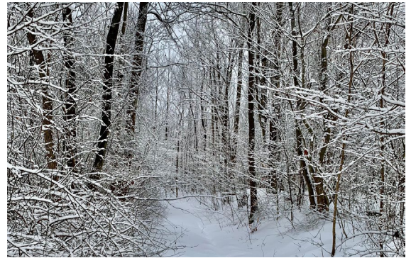
árboles cubiertos de nieve