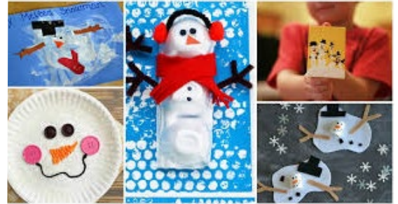
Proyectos de arte de muñeco de nieve

¿Cómo te hace sentir la nieve? ¿Qué te recuerda la nieve? Escribe un poema sobre la nieve. Cuéntale a la clase sobre un momento en que extrañaste a alguien o algo mucho. ¿Cómo te sentiste? ¿Quién te ayudó? ¿durante este tiempo? ¿Qué te hizo sentir mejor? Entrevista a alguien en su familia o comunidad que sea un inmigrante. Invítalos a hablar en su clase.